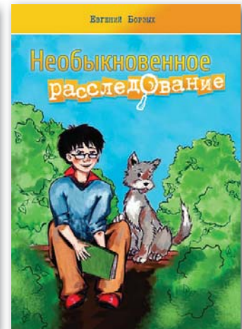
НЕОБЫКНОВЕННОЕ РАССЛЕДОВАНИЕ Евгений Борзых