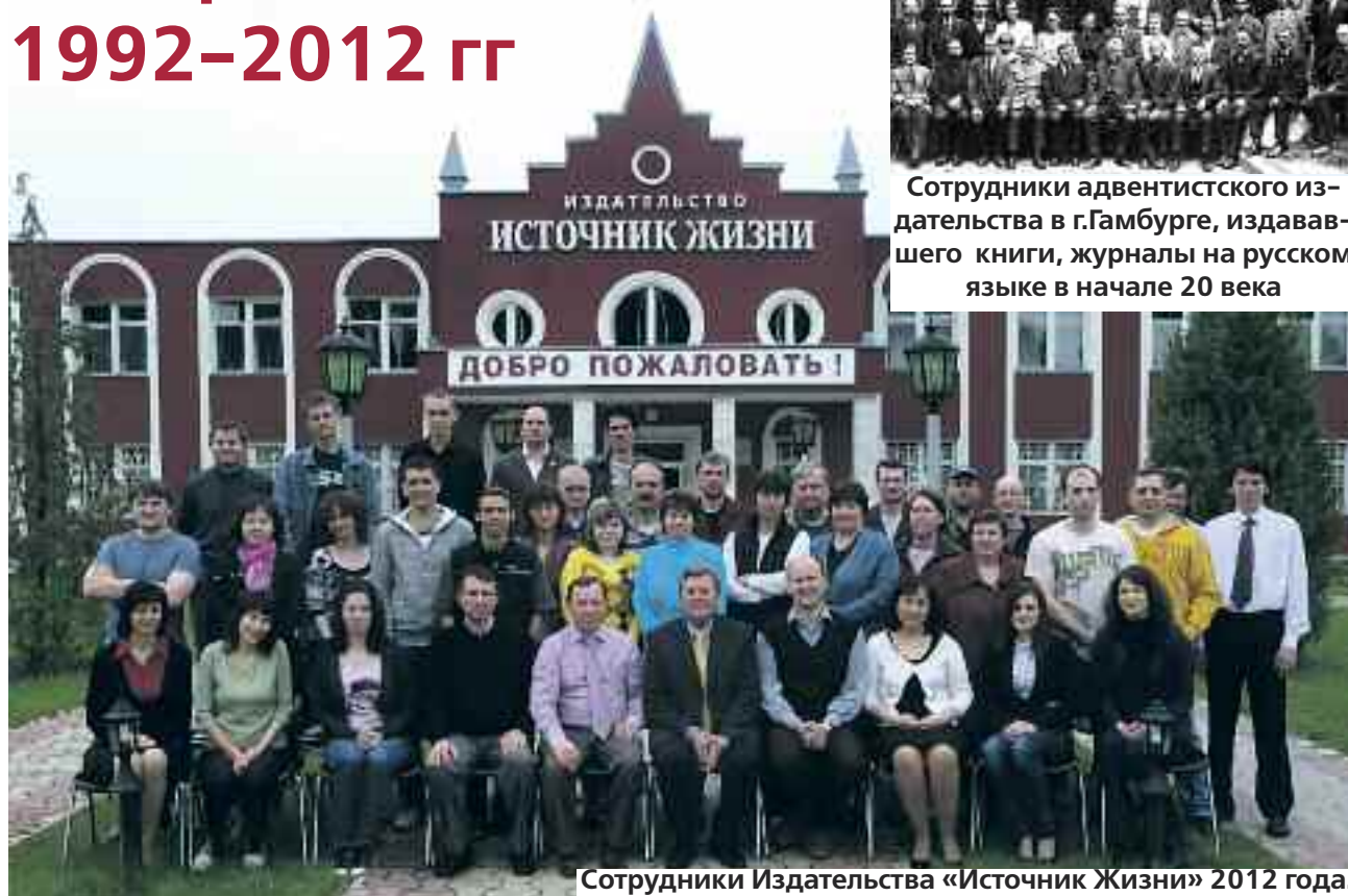
Сотрудники Издательства «Источник Жизни» 2012 года.