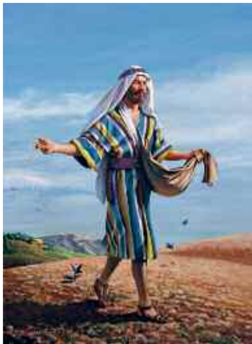
LES sow seeds of truth to reap souls

турных евангелистов: Дорогой Господь, прошу Тебя, благослови всех литературных евангелистов, кто в это время добросовестно делится Твоей вестью через печатные страницы. Помажь их Своим Святым Духом и вложи Свое Слово в каждое их представление, чтобы эти храбрые бойцы Христовы смогли вовремя донести весть искренним сердцам. Аминь.