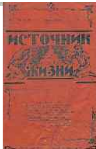
Один из первых журналов АСД 1929 год