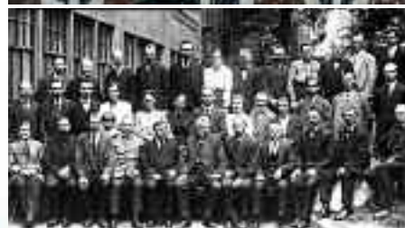
Сотрудники адвентистского издательства в г.Гамбурге, издававшего книги, журналы на русском языке в начале 20 века