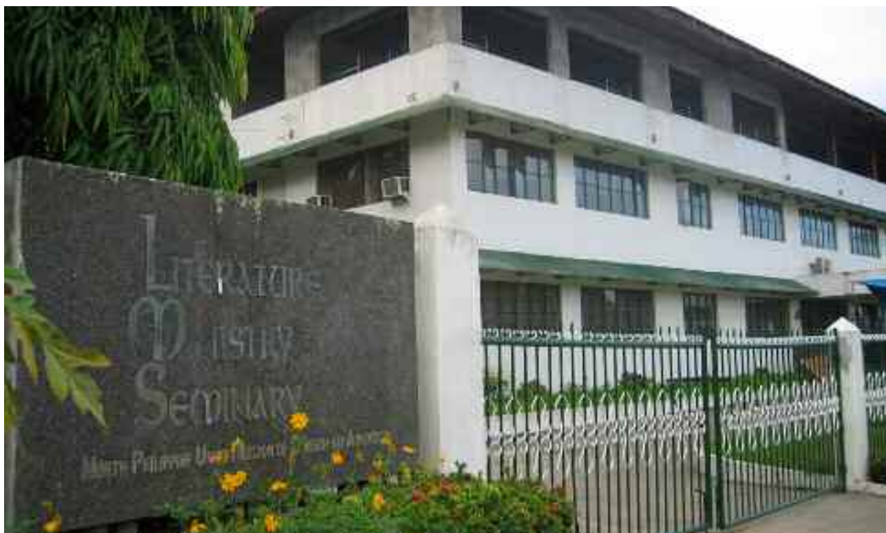
Семинария литературного служения на северных Филиппинах

Хотя большинство стран в этом дивизионе бедные или развивающиеся, и большинство населения не являются христианами, в течение 2010 года наши литературные евангелисты