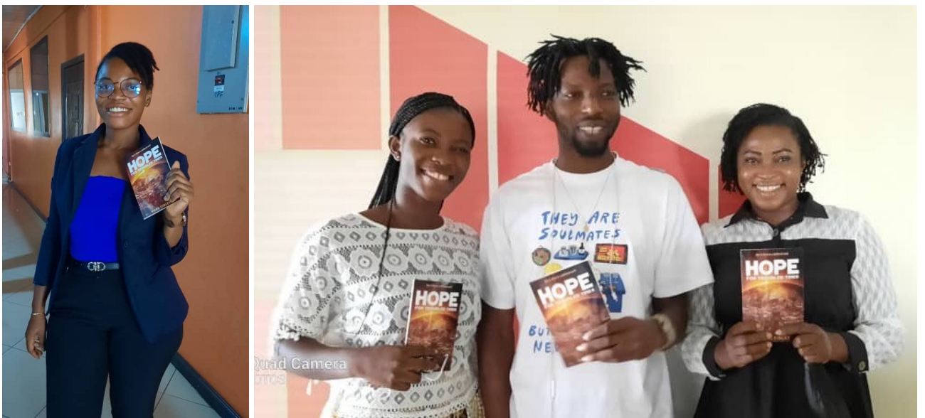
Миссионерская книга для сотрудников КенСити Медиа Хаус в Гане.