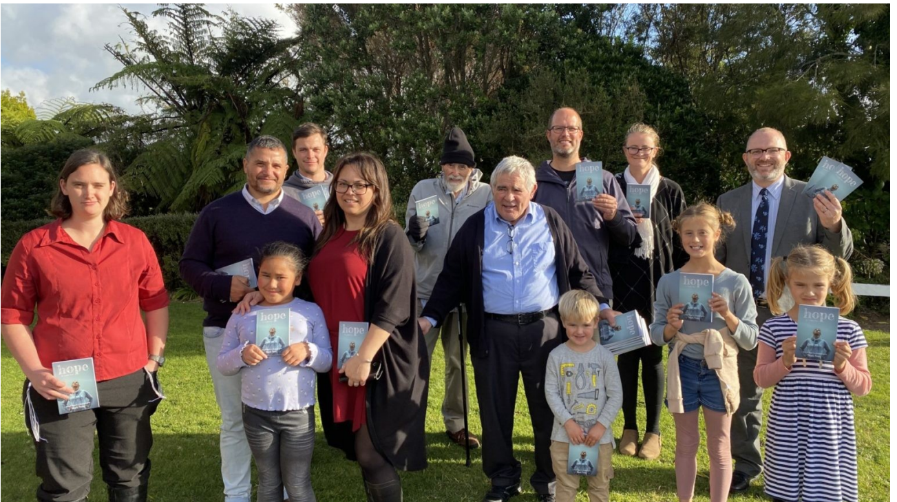
Церковь Нью Плимут, Новая Зеландия.

в субботу после обеда неотъемлемой частью их церковной программы».