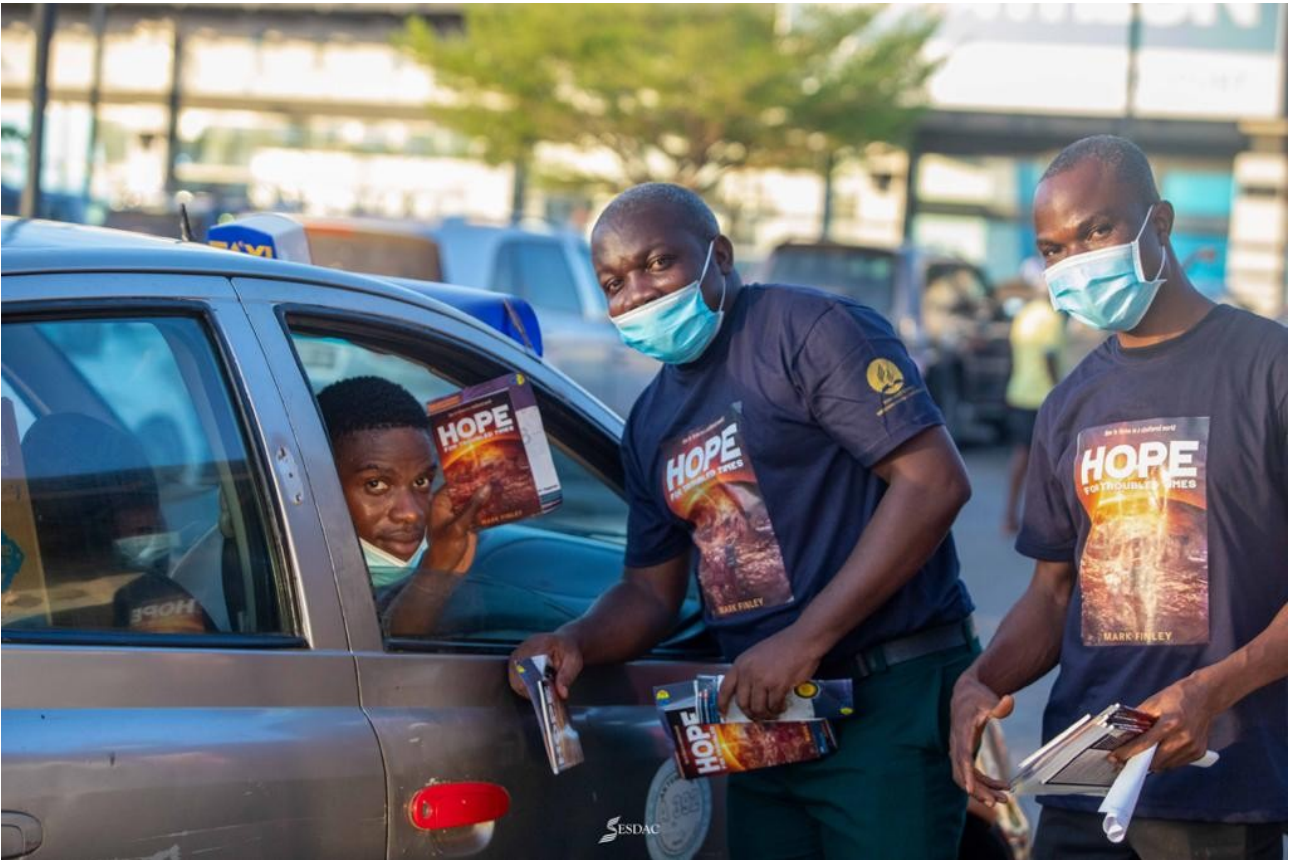
Члены церкви Конференции Меридиан Ганы вышли на улицы для распространения миссионерской книги «Надежда в пошатнувшемся мире».