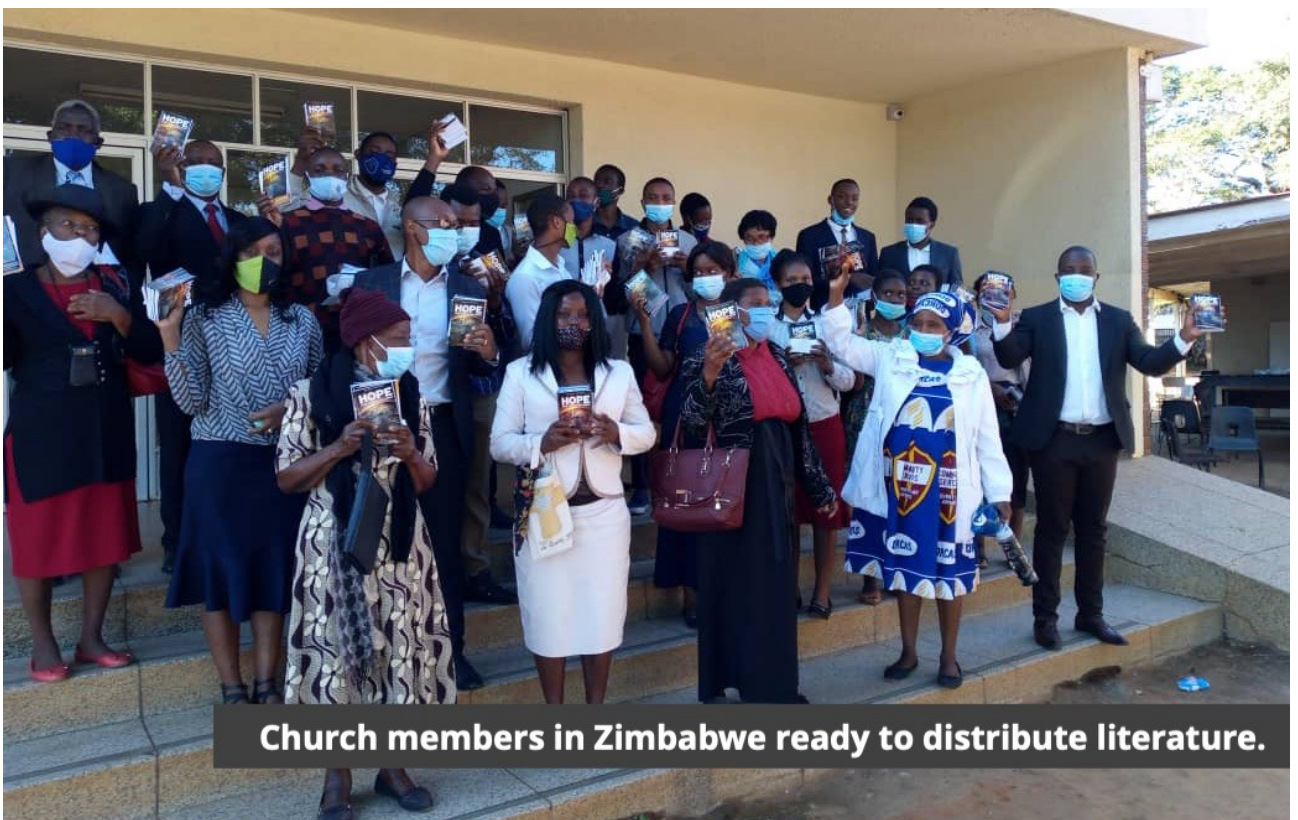
Church members in Zimbabwe ready to distribute literature.

Данная статья первоначально была опубликована Адвентист Рекорд .