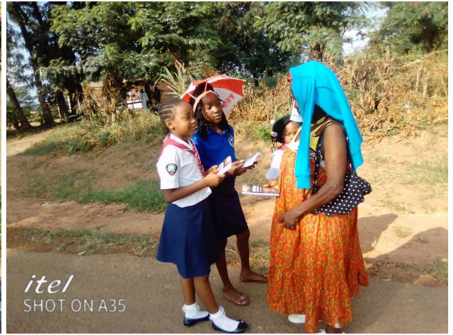
Дети и члены церкви вышли на улицы районов Кпоне Катамансо и Тема в Гане, чтобы раздавать жителям книги, наполненные надеждой.