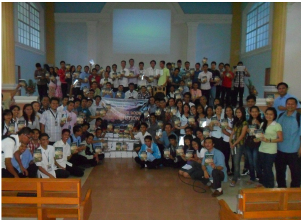
Сверху: Пасторы, спонсоры и члены ассоциации студентов ЛЕ пришли на служение посвящения «Великой борьбы». Внизу: фотография членов ассоциации студентов ЛЕ и спонсоров перед массовым распространением книги.