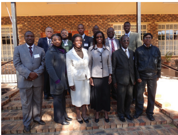
Директора, посетившие семинар для лидеров АКЦ/ООСС.

На первом этапе этого проекта ЗЦАД издает и распространяет более 6 миллионов экземпляров адаптированной версии «Великой надежды». Книга была отпечатана на всех главных языках, а также на некоторых местных диалектах, на которых говорят в Западном Центрально-Африканском дивизионе.