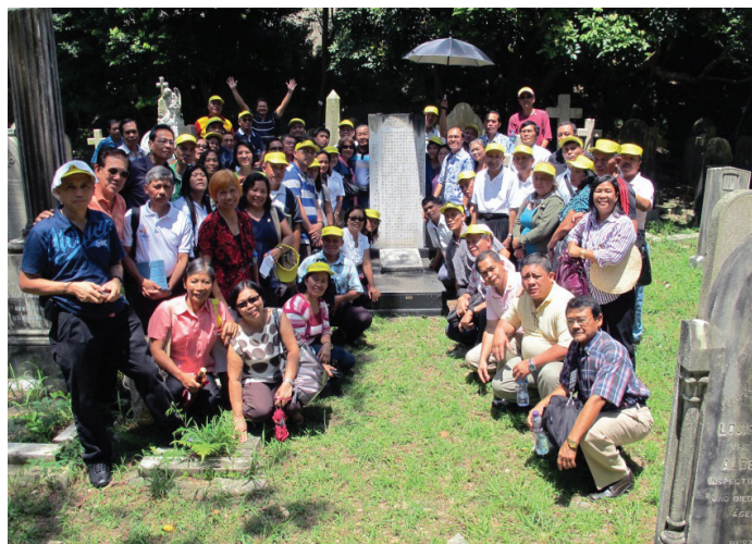
Последняя поездка 75 делегатов из Филиппин и Индонезии на место захоронения Аврама Ля Ру состоялась 2-5 июля.

Поездка координируется дивизионом и спонсируется каждым унионом. Программа включает экскурсии по историческим местам, ежедневные богослужения и особое служение посвящения в конце