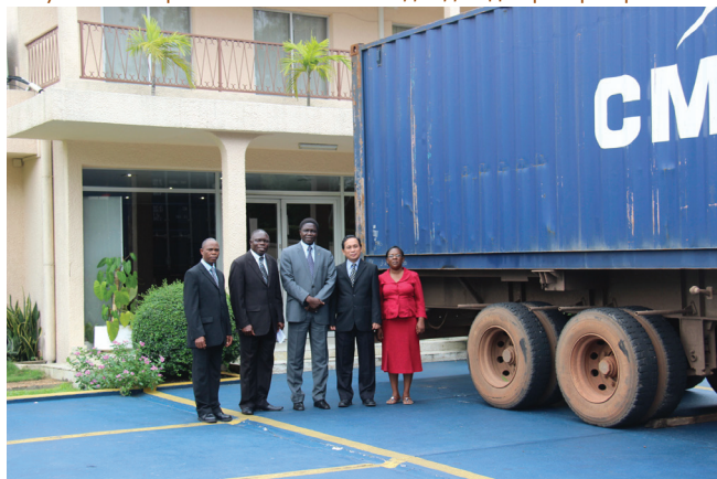
Руководство Западного Центрально-Африканского дивизиона, получившие партию книг «Великая надежда» для распространения.