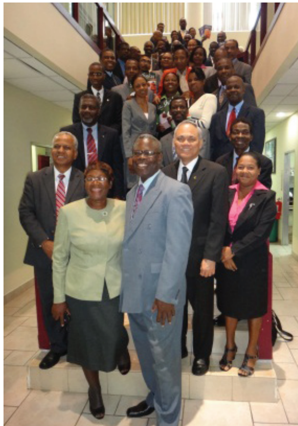
Вверху: Президент униона, исполнявший функции председателя во время проведения оценки работы отдела издательского служения, с лидерами ГК и МД. Внизу: лидеры ГК, МД и Карибского униона.