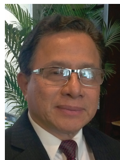
Давид Хавьер Перес – новый президент GEMA.

Давид Хавьер Перес был назначен новым президентом GEMA после избрания