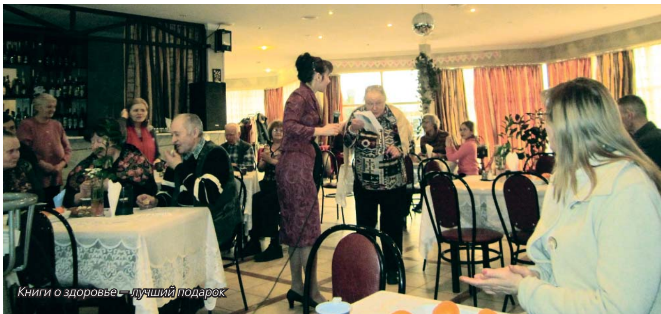
Книги о здоровье — лучший подарок