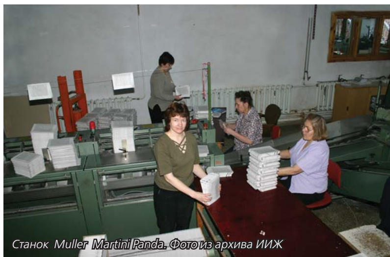
Станок Muller Martini Panda.

бесшвейного скрепления). Три дня мастер показывал мне, как работает станок, а потом три месяца я не спал, переживая о том, чтобы все получилось. Порой некому было подсказать, как работает тот или иной станок, Интернета не было, специалистов рядом —