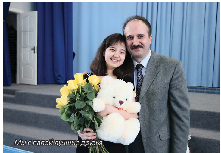
Мы с папой лучшие друзья

Мне радостно оттого, что он трудится для Бога, работая в издательстве «Источник жизни».