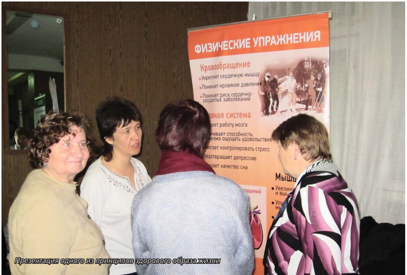
Презентация одного из принципов здорового образа жизни