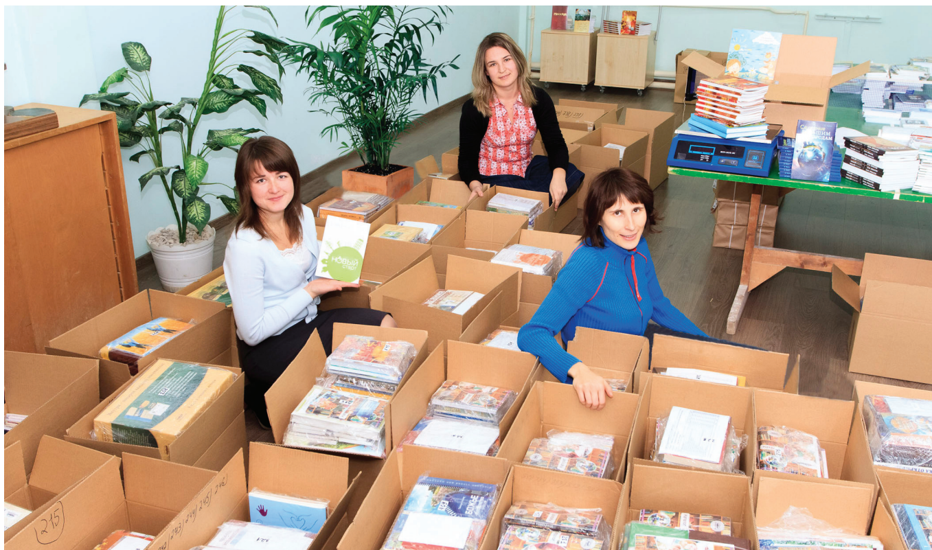
Сотрудники издательства подготовили книги к отправке

них звучал так: «Отвечают ли книги издательства «Источник жизни» на вопросы общества сегодня?» Как правило, люди давали положительный ответ.